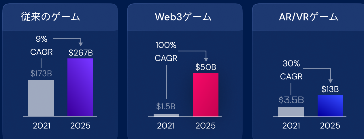
2025年におけるゲームプラットフォームのCAGR予測