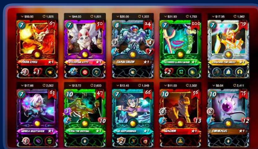
Splinterlands で異なるステータスとユーティリティを持つNFT

NFTは、ゲームのカテゴリに応じて、アバター、カード、装備品、プロパティなど、あらゆるタイプのデジタルアセットになります。